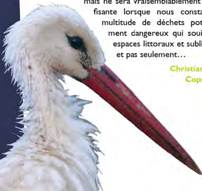
Cigogne blanche