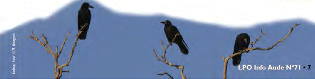
Croiseau noir