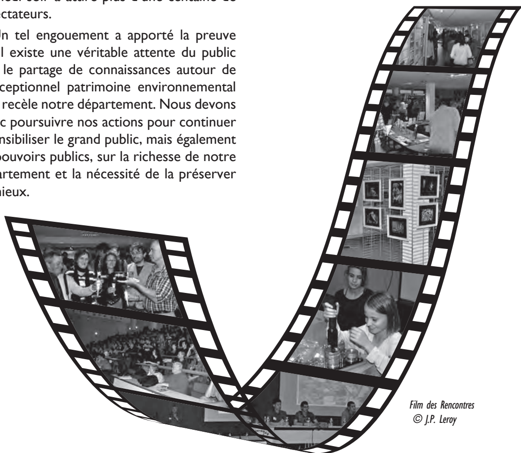
Film des Rencontres