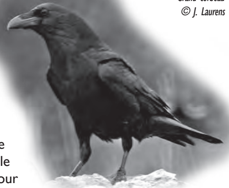
Grand corbeau © J. Laurens

Et le Corbeau dans tout ça ? Il n'entre en scène que trois fois, et, par deux fois, dans des situations qui sont loin de tourner à son avantage. En effet, non content d'avoir été roulé dans la farine, le comble pour un oiseau au noir de référence vous en conviendrez, par le matois Goupil, il prétendit imiter l'Aigle qu'il avait vu emporter un mouton dans ses serres. Mal lui en prit : s'étant empêtré les papattes dans une ovine toison – il n'a pas du Vautour la « tranchante serre » –, il est prestement capturé par le berger vigilant qui « le donne à ses enfants pour servir d'amusette ».