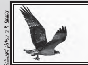
Balbuzard pêcheur

Le 1 er , 2 Oies cendrées Anser anser sur les Ayguades (Gruissan ; AJ) et 1 Vautour moine Aegypius monachus à Vinassan (YvT). Les 3 et 5, 1 Elanion blanc Elanus caeruleus à Belpèch (TG). Du 6 décembre au 16 février, 1 Balbuzard pêcheur Pandion haliaetus bagué en Allemagne sur Pissevaches (Fleury ; RS, DCL et