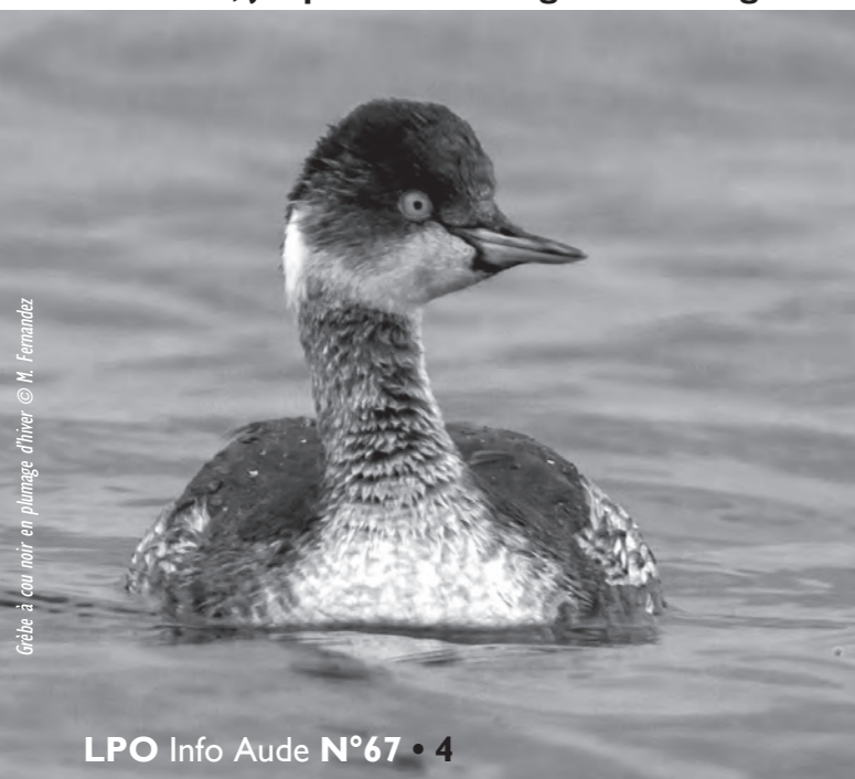
Grèbe à cou noir en plumage d'hiver