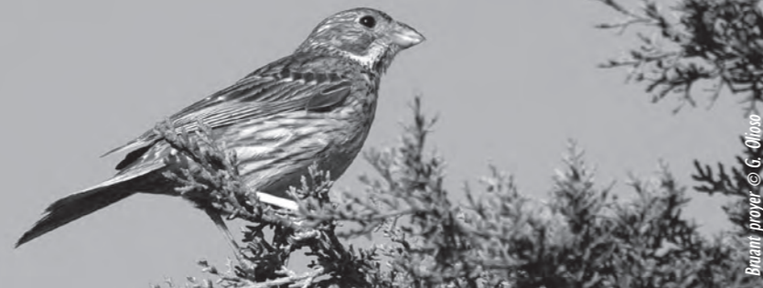
Bruant proyer