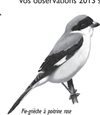
Pie-grièche à poitrine rose