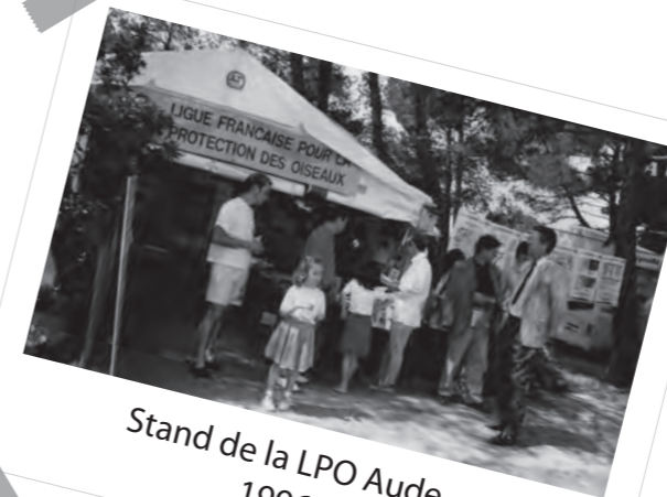
Stand de la LPO Aude 1996