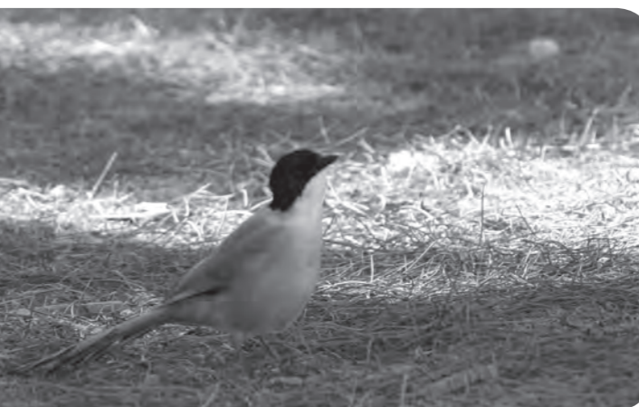
Pie bleue

L'heure d'un nouveau calendrier n'aurait-elle pas sonné ? Un calendrier moins susceptible de générer des effrois qui nous rongent, où quelques-uns des douze animaux du calendrier chinois pourraient laisser la place à quelques oiseaux. Le serpent, par exemple, s'effacerait devant l'Anhinga d'Amérique et le chien devant le Chevalier aboyeur. Quant au coq qui doit avoir oublié ses origines asiatiques et qui fait preuve d'un chauvinisme indécent depuis qu'il fanfaronne au plus haut des clochers quand il ne s'exhibe pas au sommet d'un tas de fumier, je le verrai bien remplacé par la Pie bleue Cyanopica cyanus .