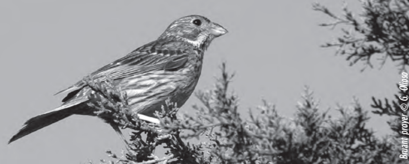
Bonant proyer © G. Oloso