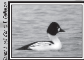
Garrot à oeil d'or