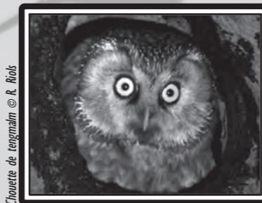
Chouette de tengmalm

al.) et 1 second sur Raissac d'Aude le lendemain (SN). Le 7, 1 Cormoran huppé de Méditerranée Phalacrocorax aristotelis desmaresti à La Franqui (FBe), 1 Plongeon catmarin Gavia stellata aux cabanes de Fleury (TG), 1 Pluvier doré Pluvialis apricaria à Raissac d'Aude (SN), puis 15 sur l'ancien étang du Cerde (Narbonne) le 8 (TG) et encore 2 à Coursan le 23 (DCL). Le 11, 1 Corbeau freux Corvus frugilegus à Belfou (EM). Le 12, ~10 Venturons montagnards Serinus citrinella à Pradelles-cabardès (C. Daussin) et 1 Gobemouche nain Ficedula parva à Couffoulens (PP). 1 Bruant fou Emberiza cia à Saint-André-de-Roquelongue le 14 (GeO). 2 Cygnes noirs Cygnus atratus sur Campagnol le 16 (MB). Le 22, 1 Cigogne noire Ciconia nigra à Leucate (C. Fridlender). Le 23, 1 Aigle de Bonelli Aquila fasciata à Albas (GeO). 21 Pingouins torda Alca torda aux cabanes de Fleury le 24 (DCL). Le 28, 1 Chouette de Tengmalm Aegolius funereus à Fontanès-de-Sault (RR), 1 Marouette ponctuée Porzana porzana à Port-la-Nouvelle (GeO) et 1 Butor étoilé Botaurus stellaris sur Pissevaches (M. Orth). Le 29, 3 Grands Tétràs Tetrao urogallus aquatonicus à Camurac (C. Francoise).