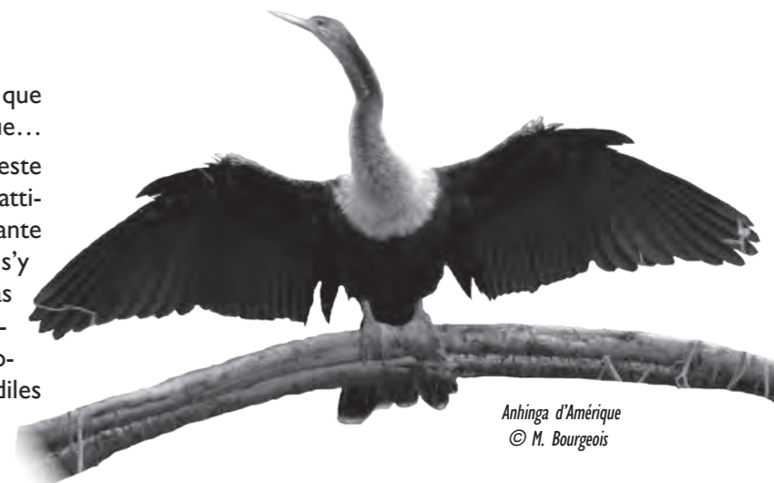
Anhinga d'Amérique

Oublier, oublier, que nenni s'écrient les anxieux et autres caudataires de l'anéantissement définitif de notre planète qui nous lanceront un angoissé : Nous venons d'entrer dans l'année du serpent ! Vous êtes au courant ?