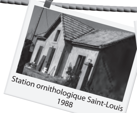
Station ornithologique Saint-Louis 1988