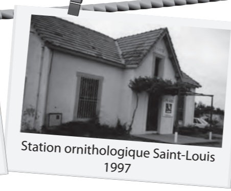
Station ornithologique Saint-Louis 1997