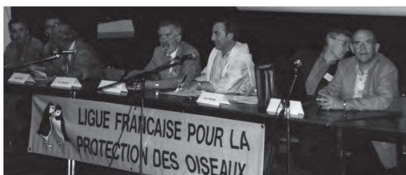
AG de la LPO France à Gruissan, 1995