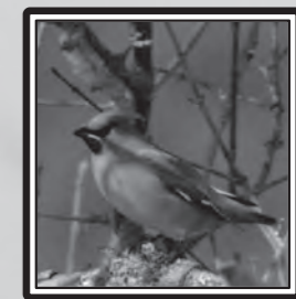
Jaseur boréal