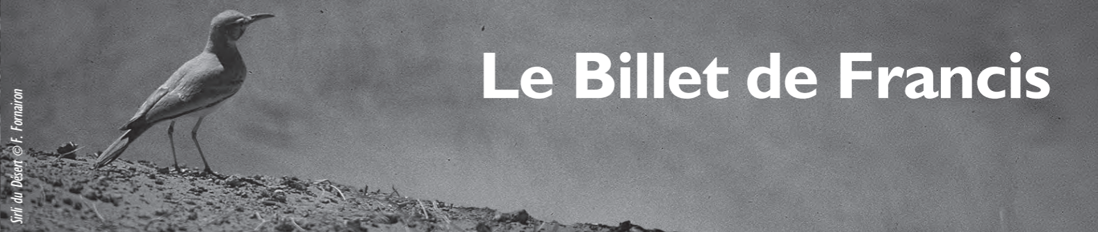
Sirif du Desert © F. Fornairon