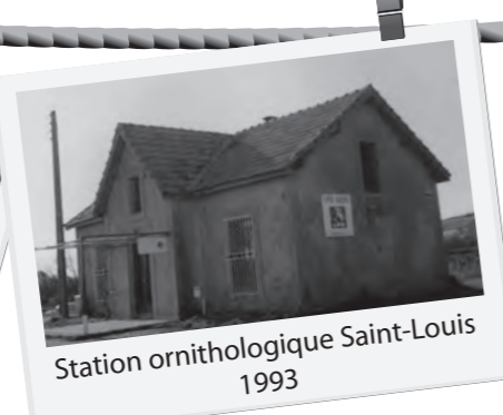
Station ornithologique Saint-Louis 1993