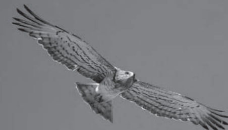
Circaète Jean-le-Blanc