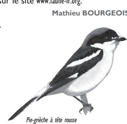
Pie-grièche à tête rousse