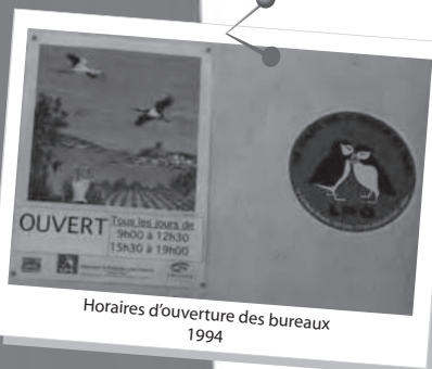
Horaires d'ouverture des bureaux 1994