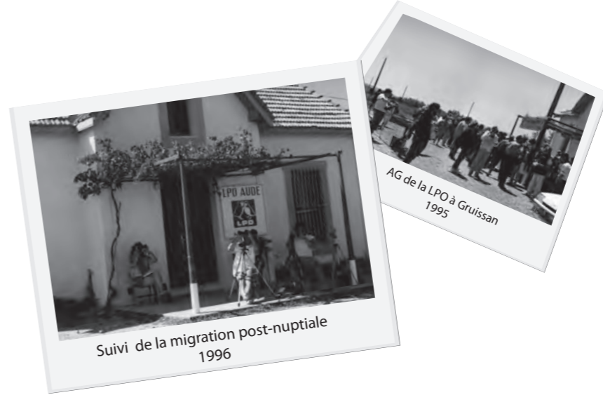
Suivi de la migration post-nuptiale 1996

En 1996, une action originale, alliant protection des espèces et des milieux et sensibilisation des acteurs locaux débouche sur la création d'une cuvée « Pie-grièche à poitrine rose » (une des espèces les plus menacées de France) en collaboration avec les vignerons du Pays d'Ensérune, en Basse plaine de l'Aude. C'est aussi la période où nous décidons de nous investir plus fortement dans la création de « Refuges LPO » (6 refuges existants à cette époque).