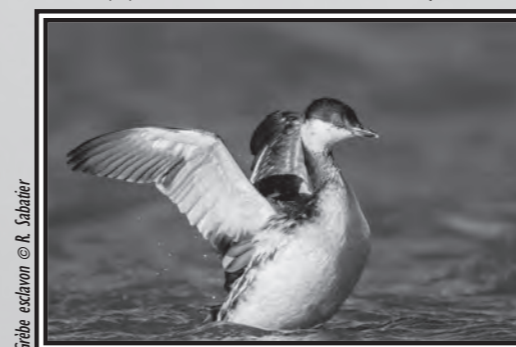
Grèbe esclavon

Le 17, 2 Jaseurs boréaux Bombcilla garrulus à Saint-Louis-et-Parahou (YL), 1 Coucou geai Clamator glandarius à Leucate (FD) puis 1 à Vinassan (PT) le 28.