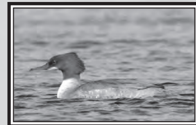
Harle bièvre

criards Burhinus oedicnemus sur l'ancien étang du cerde (DG, BD, PT), 1 Fuligule nyroca Aythya nyroca et 1 Plongeon imbrin Gavia immer sur la Ganguise (TG), 1 Plongeon catmarin à Narbonne-Plage (Y. Borremans) et 1 femelle de Harle bièvre Mergus merganser sur l'étang de Jouarres (Azille ; SN, AIB, PP et al.), revue le 14/01 (TG). Le 20, 2 Chouettes de Tengmalm Aegolius funereus à Camurac (X. Ruffray). Le lendemain, 5 Niverolles alpines Montifringilla nivalis à Camurac (F. Isambert fide CR). 3 Macreuses brunes Melanitta fusca sur Leucate le 19 (CeP) puis 1 sur Pissevaches le 27 (YvT). Le 29, 1 Butor étoilé sur Narbonne (AIB).