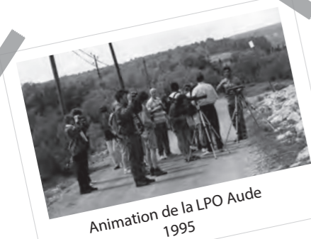
Animation de la LPO Aude 1995