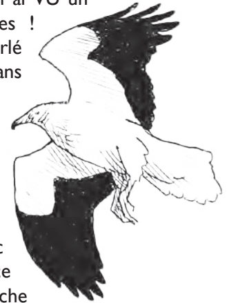
Vautour percnoptère