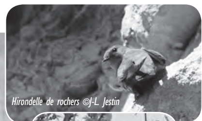
Hirondelle de rochers