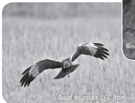
Busard des roseaux