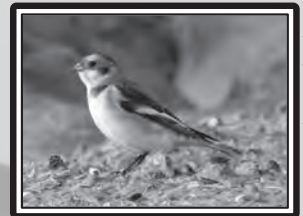
Bruit des neiges

Le 1er, 2 Grèbes esclavons aux cabanes de Fleury (RS), revus le lendemain (MF & RS), puis 1 en plumage nuptial le 19 sur ce même site (RS), revu le 20 (MF & RS). Le 2, 5 Pingouins torda au large de La Franqui (DCL), 1 Sterne hansel Sterna nilotica à Narbonne-Plage puis 1 le 20 aux Cabanes de Fleury (FBe). 3 Pélicans blancs Pelecanus onocrotalus au sud de Narbonne (DCL & H. Picq) le 4 puis 1 adulte à Roquefort-des-Corbières le 20 (TG). 230 Corneilles noires Corvus corone en regroupement vespéral à Roquefeuil le 8 (CR). 1 Plongeon catmarin Gavia stellata devant la Franqui le 15 (TG). 1 mâle adulte de Busard pâle Circus macrourus à Bouilhonnac le 17 (YB). Le 22, 1 Hibou des marais à Villasavary (M. Perez) et 1 Marouette ponctuée aux Coussoules (TG), puis 1 à Lézignan-Corbières le 24 (DGe). 1 adulte forme claire de Faucon d'Eléonore Falco eleonorae sur le Plateau de Leucate le 24 (LC). 1 Vautour moine Aegypius monachus (bagué en France) à Joucou le 25 (CR).