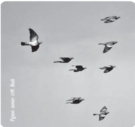
Pigeon ramier