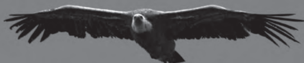
Vautour fauve