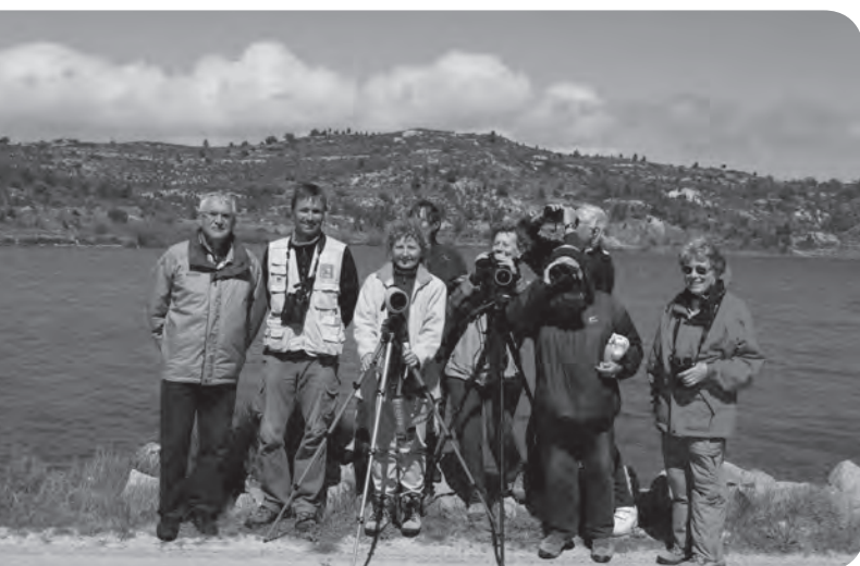
Participants au séjour Nature 2012