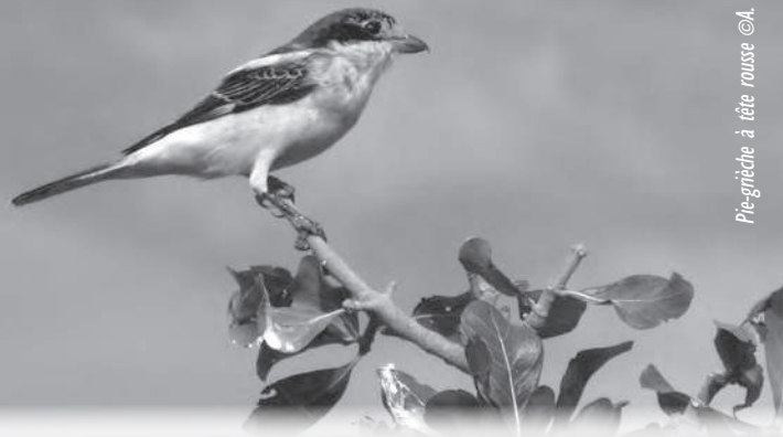
Pie-grèche à tête rousse