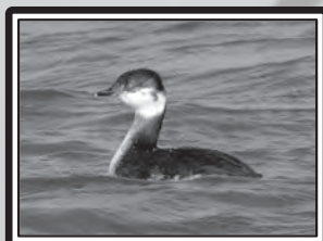
Grèbe esclavon

Le 4, 1 Vautour fauve Gyps fulvus sur la Clape (RS), toujours présent le 12 (MF). 5 Pingouins torda Alca torda 5 en vol au large de Port-la-Nouvelle le 5 (GeO). Le 6, 1 Tichodrome échelette à Couzozouls (YR : le même qu'en janvier ?), 1 Bécassine sourde Limnocyptus minimus sur Pissevaches (Fleury d'Aude) (JMT) et 1 Aigle botté Aquila pennata sur la Clape (DCL et FFr). Le 7, 21 Avocettes élégantes Recurvirostra avosetta (peu commune en hiver dans l'Aude) entre Peyriac et Bages (ER & CaP) et 2 Goélands cendrés Larus canus à Port-la-Nouvelle (GeO). 1 Oedicnème criard Burhinus oedicnemus à Pissevaches le 11 (MF et RS). 3 Etourneaux unicolores Sturnus unicolor à Borde Grande (Laroque-de-Fa) ; hors de leur aire de répartition (littoral) le 16 (MV). 26 Renards roux Vulpes vulpes en chasse entre Espezel et Roquefeuil le 18 (CR). 1 Grèbe esclavon Podiceps auritus aux cabanes de Fleury les 20 et 21 (RS & MF), revu le 29 (RS & FBe). 11 Niverolles alpines sur le Pic de Nore le 27 (C. Tessier), puis 15 le lendemain (C. Daussin). Le 29, 1 Marouette ponctuée Porzana porzana à Sigean (GeO) et 1 Fuligule milouinan Aythya marila aux cabanes de Fleury le 29 (TG).