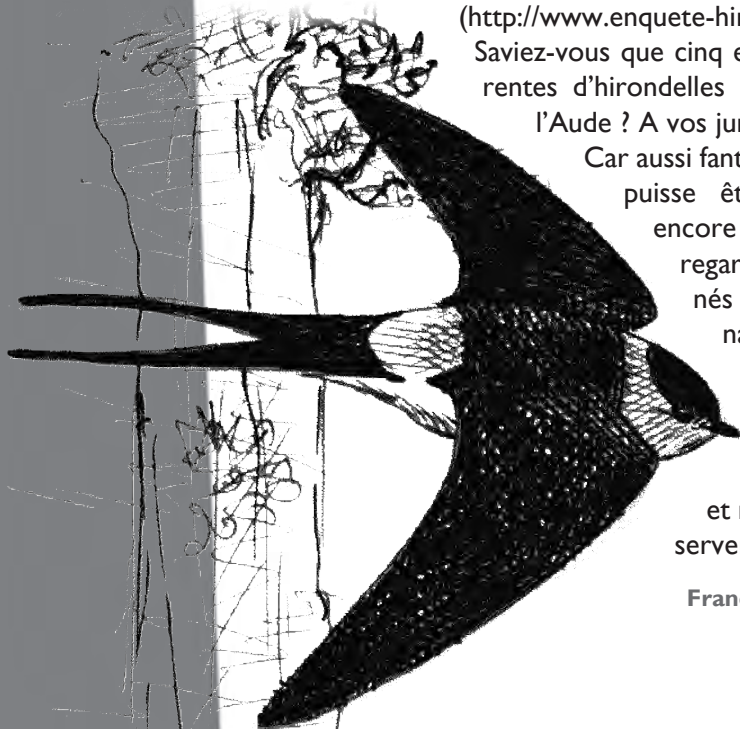
Hirondelle rousseline