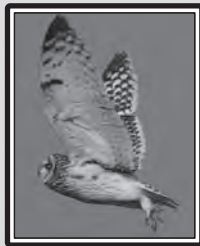
Hibou des marais

Le 12, 1 Tichodrome échelette Tichodroma muraria à Couzozouls (CR). 1 Chevalier à pattes jaunes Tringa flavipes à l'écluse de Mandirac (Narbonne) le 14 (FBe, MB, FM, PT, FBI, V. Thivent & E. Bugot), revu le 18 (SN & JLC), le 19 (TG et al.), le 20 (MF, SA, GeO, RS, CeP et al.), le 21 (SR) et le 22 (A. Labouille). Macreuse brune Melanitta fusca à La Franqui le 14 (CeP), puis 1 à Port-la-Nouvelle le 17 (GeO). 2 Bruants des neiges Plectrophenax nivalis sur la plage de Gruissan le 17, 18 et 21 (RS). 13 Niverolles alpines Montifringilla nivalis sur le Pic de Nore (Pradelles-Cabardès) le 22 (B. Long). 1 Hibou des marais Asio flammeus aux Aiguades, le 28 (RS & MF) et 1 Buse pattue Buteo lagopus à la Plaïgne (TG) le 29.