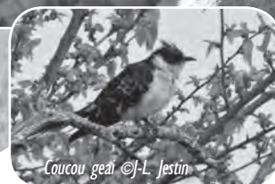
Coucou geai