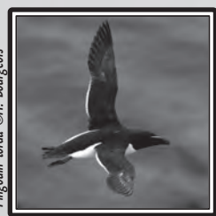
Pingouin torda

Le 4, 1 Vautour fauve Gyps fulvus sur la Clape (RS), toujours présent le 12 (MF). 5 Pingouins torda Alca torda 5 en vol au large de Port-la-Nouvelle le 5 (GeO). Le 6, 1 Tichodrome échelette à Couzozouls (YR : le même qu'en janvier ?), 1 Bécassine sourde Limnocyptus minimus sur Pissevaches (Fleury d'Aude) (JMT) et 1 Aigle botté Aquila pennata sur la Clape (DCL et FFr). Le 7, 21 Avocettes élégantes Recurvirostra avosetta (peu commune en hiver dans l'Aude) entre Peyriac et Bages (ER & CaP) et 2 Goélands cendrés Larus canus à Port-la-Nouvelle (GeO). 1 Oedicnème criard Burhinus oedicnemus à Pissevaches le 11 (MF et RS). 3 Etourneaux unicolores Sturnus unicolor à Borde Grande (Laroque-de-Fa) ; hors de leur aire de répartition (littoral) le 16 (MV). 26 Renards roux Vulpes vulpes en chasse entre Espezel et Roquefeuil le 18 (CR). 1 Grèbe esclavon Podiceps auritus aux cabanes de Fleury les 20 et 21 (RS & MF), revu le 29 (RS & FBe). 11 Niverolles alpines sur le Pic de Nore le 27 (C. Tessier), puis 15 le lendemain (C. Daussin). Le 29, 1 Marouette ponctuée Porzana porzana à Sigean (GeO) et 1 Fuligule milouinan Aythya marila aux cabanes de Fleury le 29 (TG).