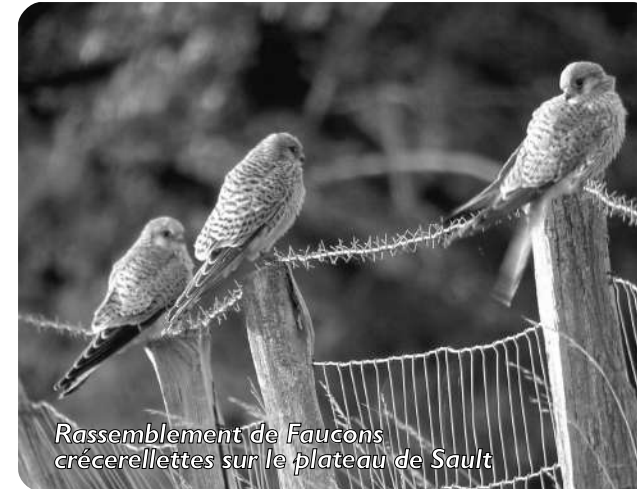
Rassemblement de Faucons crécerellettes sur le plateau de Sault

Depuis 2003, des rassemblements pré-migratoire concernant plusieurs centaines de Faucon crécerellette sont observés des Pyrénées au sud du Massif central.