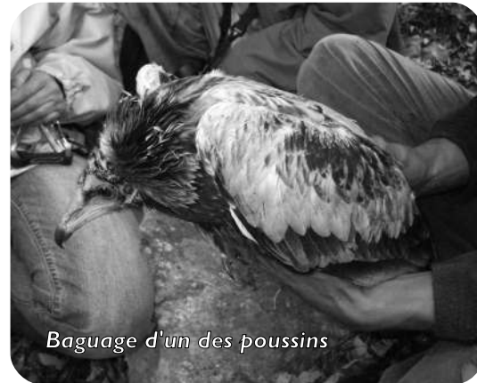
Baguage d'un des poussins