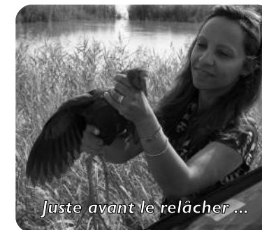
Juste avant le relâcher ...

Haut sur patte, d'une magnifique couleur bleue avec un bec robuste rouge, il n'y avait pas de doute, il s'agissait bien de la Talève sultane. Récupérée sur ce site insolite avec pour diagnostic, une luxation du bassin, la Talève sultane a été prise en charge par la LPO Aude.