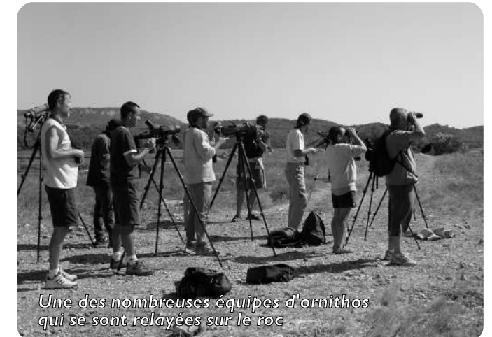
Une des nombreuses équipes d'ornithos qui se sont relayées sur le roc