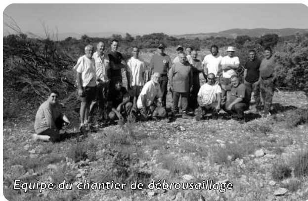
Equipe du chantier de débroussaillage

Le samedi 11 août au matin, la LPO Aude aidée par des habitants et l'ACCA d'Embres-Castelmaure ont nettoyé les surfaces brûlées des arbres et arbustes non consommés par le feu suite à un brûlage dirigé réalisé dans le cadre du programme LIFE « Basses Corbières ».