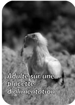
Adulte sur une placette d'alimentation

2007, une année d'exception pour les percnos audois