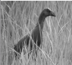
La présence de la Talève sultane dans les roselières du narbormais est due à la bonne gestion de l'eau faite par l'ADGE.

Ces derniers temps, la LPO Aude a fait beaucoup parler d'elle dans la presse locale : de la protection de la Mare de Leucate et ses Cistudes, au braconnage d'une buse sur La Clape en passant par la volonté de l'association de collaborer avec les chasseurs pour protéger les zones humides du littoral. Cette dernière intervention a pu en surprendre quelques-uns, étant donné que la LPO Aude a plutôt tendance à dénoncer les agissements de ceux parmi les chasseurs qui enfreignent la loi. Mais il ne faut pas oublier que le monde de la chasse est varié, et qu'il ne faut pas, à cause des comportements d'une minorité de têtes de bois, rejeter toute coopération avec le monde cynégétique, et affirmer que leur action est forcément négative.