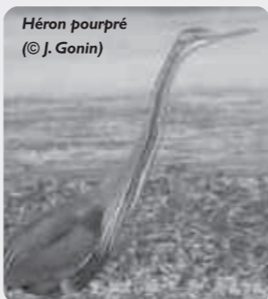
Héron pourpré

1 Héron pourpré à Capestang le 18 (AJL) et 1 Buse féroce** sur Pissevaches le même jour (JM Toublanc). 1 Mouette tridactyle depuis la digue de la Mateille (CS, TRU, CC et al.). 1 Elanion blanc** sur Fleury d'Aude le 27 (PC). 1 Goéland pontique* sur les salins de Gruissan le 30 (F. Legendre et C. Peignot), 2 Vanneaux huppés sur Espezel le même jour (CR).