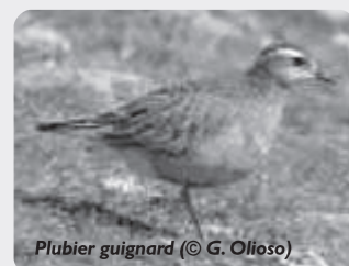
Pluvier guignard

Le 1er, plus de 380 Faucons crécerelletes en montagne noire (MB, I. Boulicot et al.), 66 sur Canet d'Aude (SA), 10 sur Roquecourbe (CS et A. Boyé), 10 sur Serviès-en-Val (MV) et 8 sur le Minervo (VL, B. Dubost et V. de la Croix). 30 Outardes canepetières et 47 Oedicnèmes criards entre Ouveillan et Cuxac d'Aude le 3 (DCL). 2 Balbusards pêcheurs à l'ouest de Tuchan le 10 (FB). 5 Bécasseaux maubèches à Gruissan (FGA) et 1 Bécasseau tacheté sur les salins de Port-la-Nouvelle le 11 (GeO). 1 Goéland brun en migration sur le Plateau de Sault le 13 (RR). 13 Pluviers guignards en Basses Plaines de l'Aude le 19 (VL). 1 Hirondelle sp. leucique sur Pissevaches le 20 (B. et MF) revue le 23 sur Pissevaches (VL)