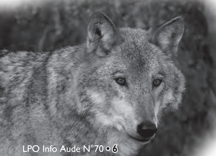
Loup gris