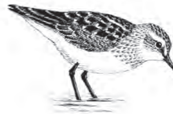
Bécasseau minute et Avocette élégante

Depuis, le succès est constant : à chaque sortie proposée, un minimum de 20 personnes sont présentes.